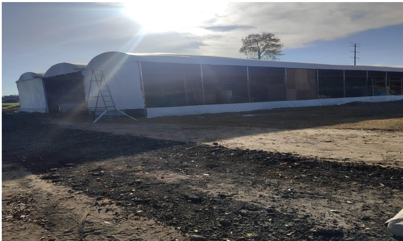
MACROTUNEL PARA LA PRODUCCION DE ORNAMENTALES CON CUBIERTA

IMAGEN DE REFERENCIA. MACROTUNEL PARA LA PRODUCCION DE ORNAMENTALES, DE HASA 1,400 M2 CON CUBIERTA