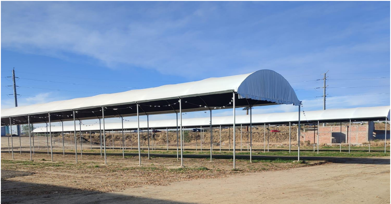
MACROTUNEL PARA LA PRODUCCION DE ORNAMENTALES